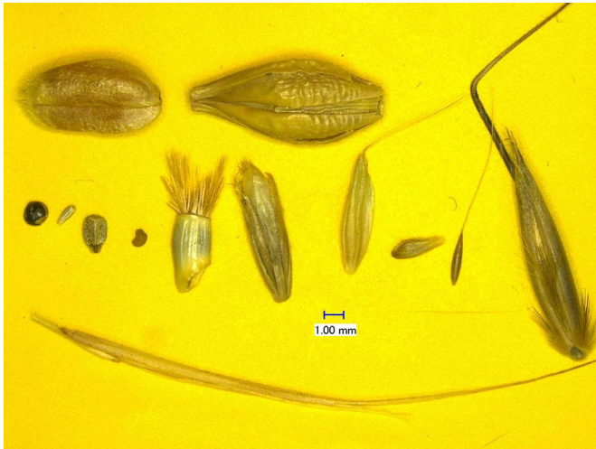
Abb. 2: Größenverhältnisse beispielhaft untersuchter Samen Oben: Weizen, Gerste Mitte: Weißer Gänsefuß, Kamille, Taubnessel, Klatschmohn, Kornblume, Weidelgras, Ackerfuchsschwanz, Jährige Rispe, Windhalm, Flughafer Unten: Taube Trespe