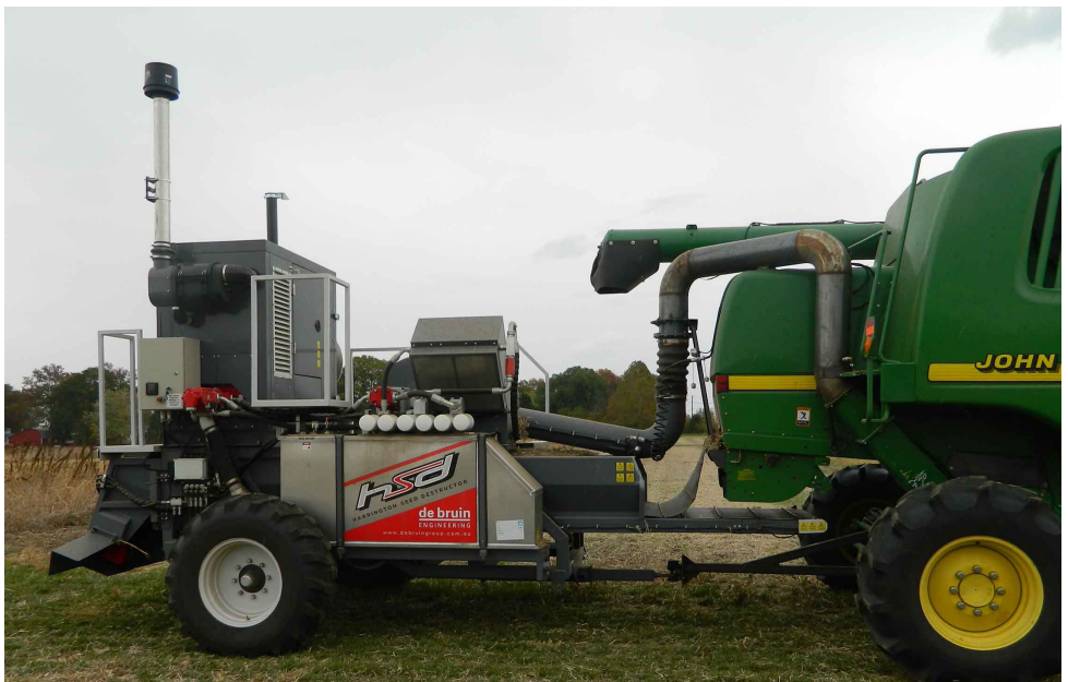
Abb. 3: Spreumühle - Harrington Seed Destructor